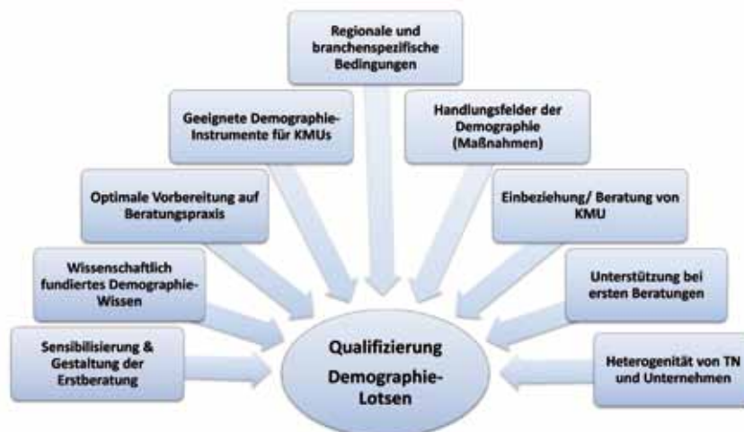
Abbildung 1: Anforderungen an die Basisqualifizierung

Das IAW befasst sich innerhalb des Projektes insbesondere mit der Konzeption des Curriculums für die Basisqualifizierung der Demographie-Lotsen so-